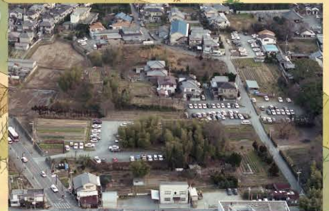
私部城跡を西から望む