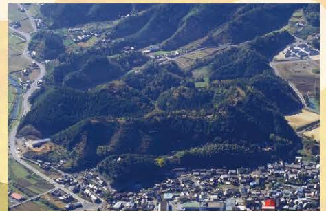
河後森城跡を北から望む

昨年、交野市指定文化財(史跡)となった私部城 その城主・安見氏と 伊予河後森城主の安見氏との関係性を探る